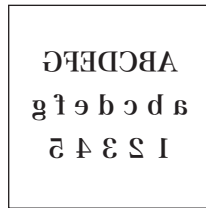
図柄を反転で印刷